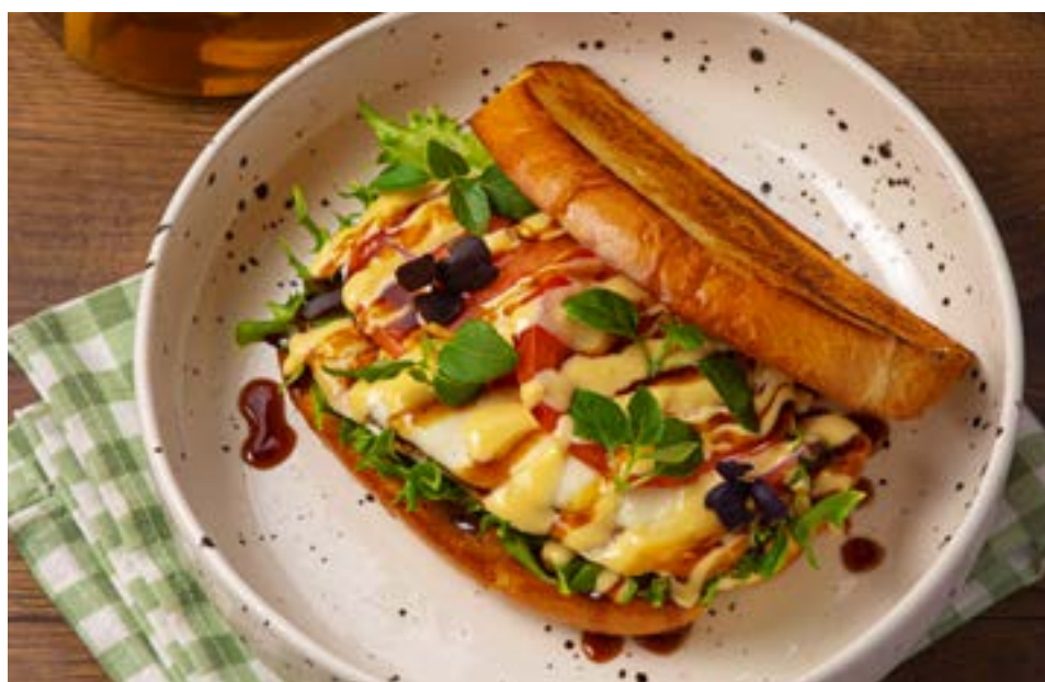
С КУРИЦЕЙ И МОЦАРЕЛЛОЙ