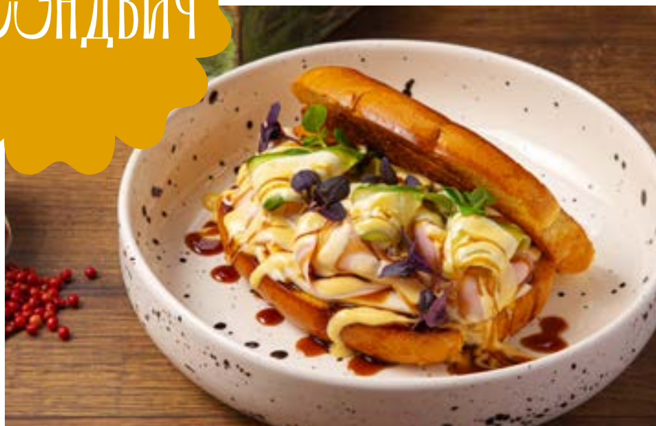
С ВЕТЧИНОЙ И МОЦАРЕЛЛОЙ