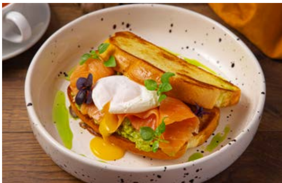
С ЛОСОСЕМ И АВОКАДО