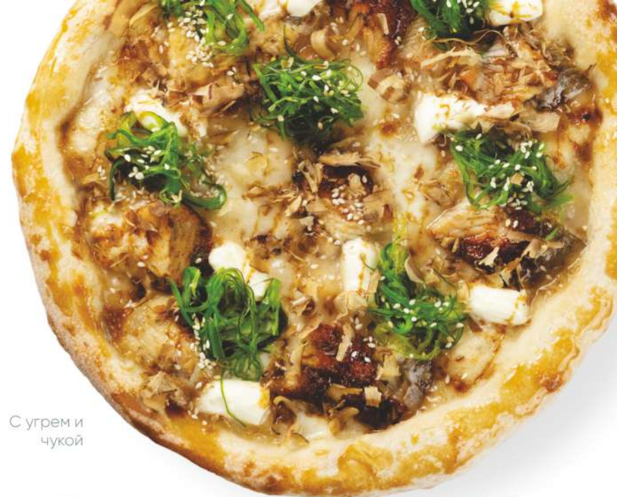
С угрём и чукой

Pizza with eel and chuka - nut sauce, mozzarella, cremette, eel, chuka, white sesame, unagi, bonito chips