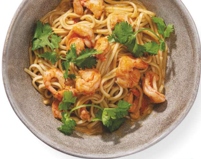
Лапша ям с креветкой