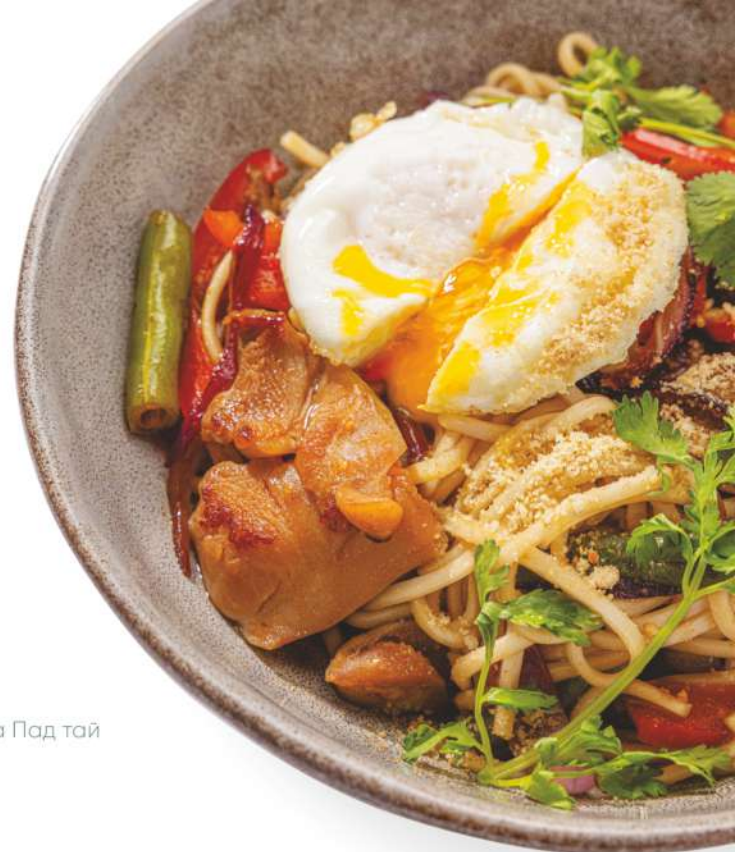
Лапша Пад тай