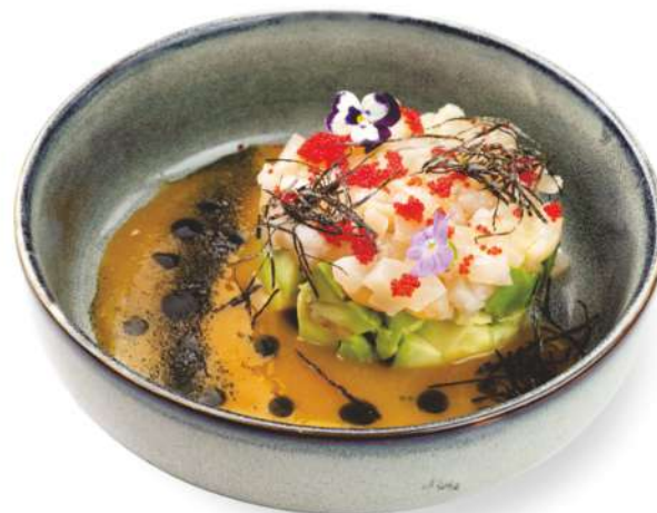
Тартар из гребешка