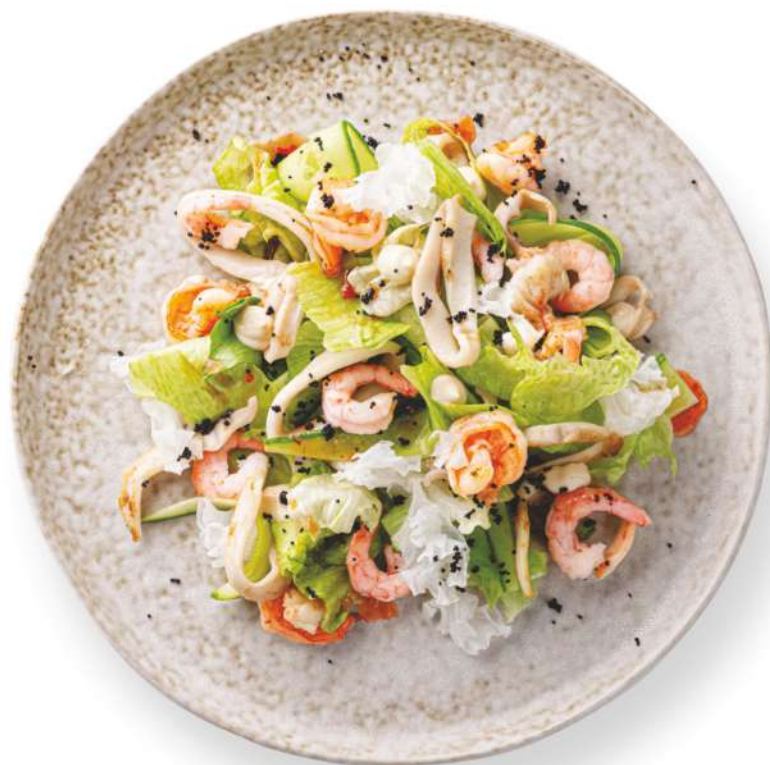
Салат с морепродуктами