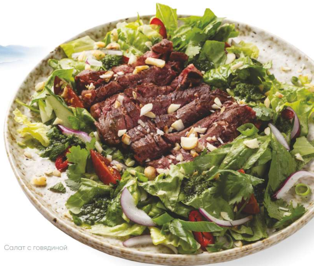
Салат с говядиной

Duck salad – salad mix, pickled papaya, fresh cucumber, dried duck, quail egg, celery kataifi