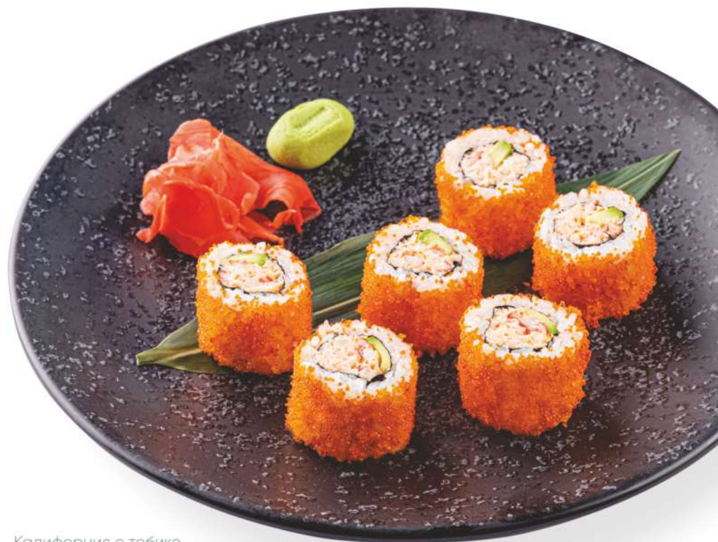
Калифорния с тобико

японский рис, нори, крабовый замес, авокадо, кунжут California with sesame seeds (Japanese rice, crab mixture, avocado, sesame)