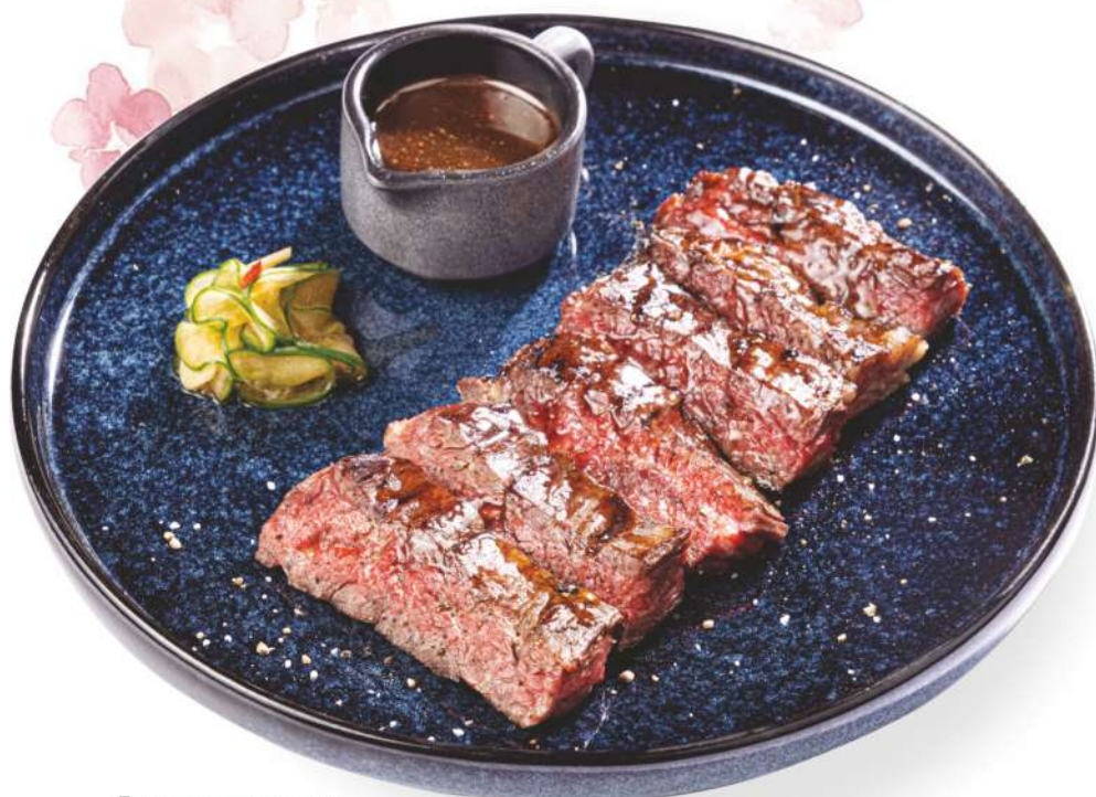
Говядина чар сью

Tuna and fried rice with coconut - lightly fried sesame breaded tuna with fried rice, coconut and onion. Served with broken cucumbers, green onions, coriander and unagi sauce