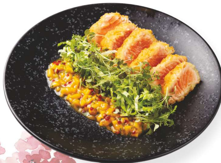
Лосось сашими Катцу

Sashimi Katsu salmon is a fillet of Murmansk salmon, in panko breadcrumbs. Served with mango chutney, iceberg lettuce and mizuna microgreen