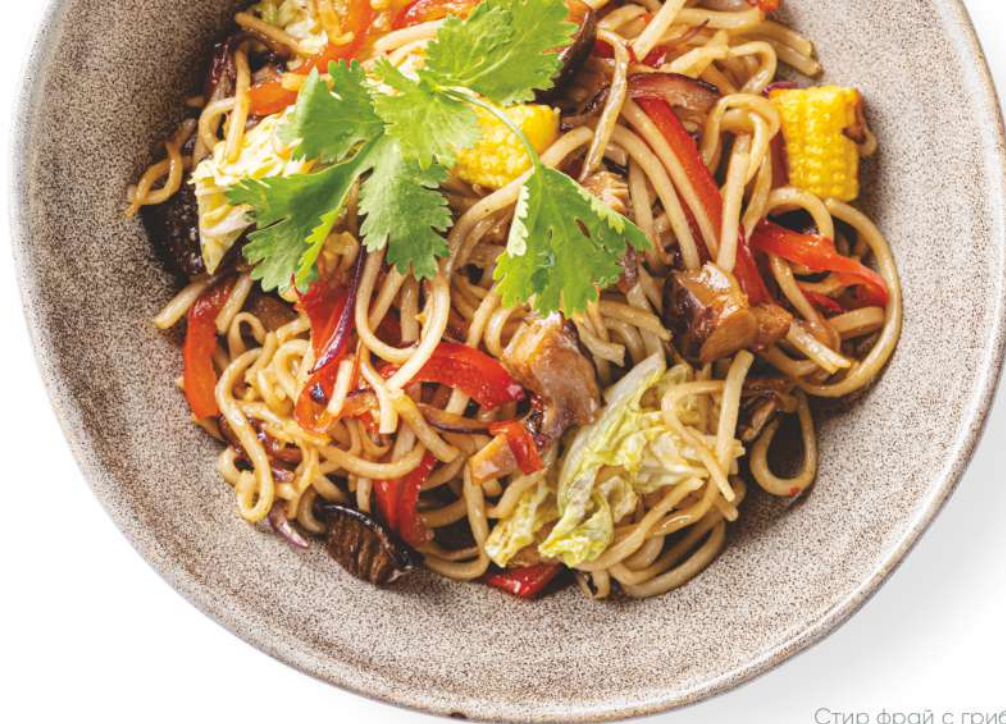
Стир фрай с грибами