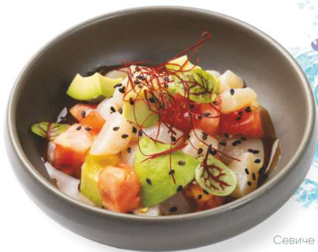
Севиче из гребешка