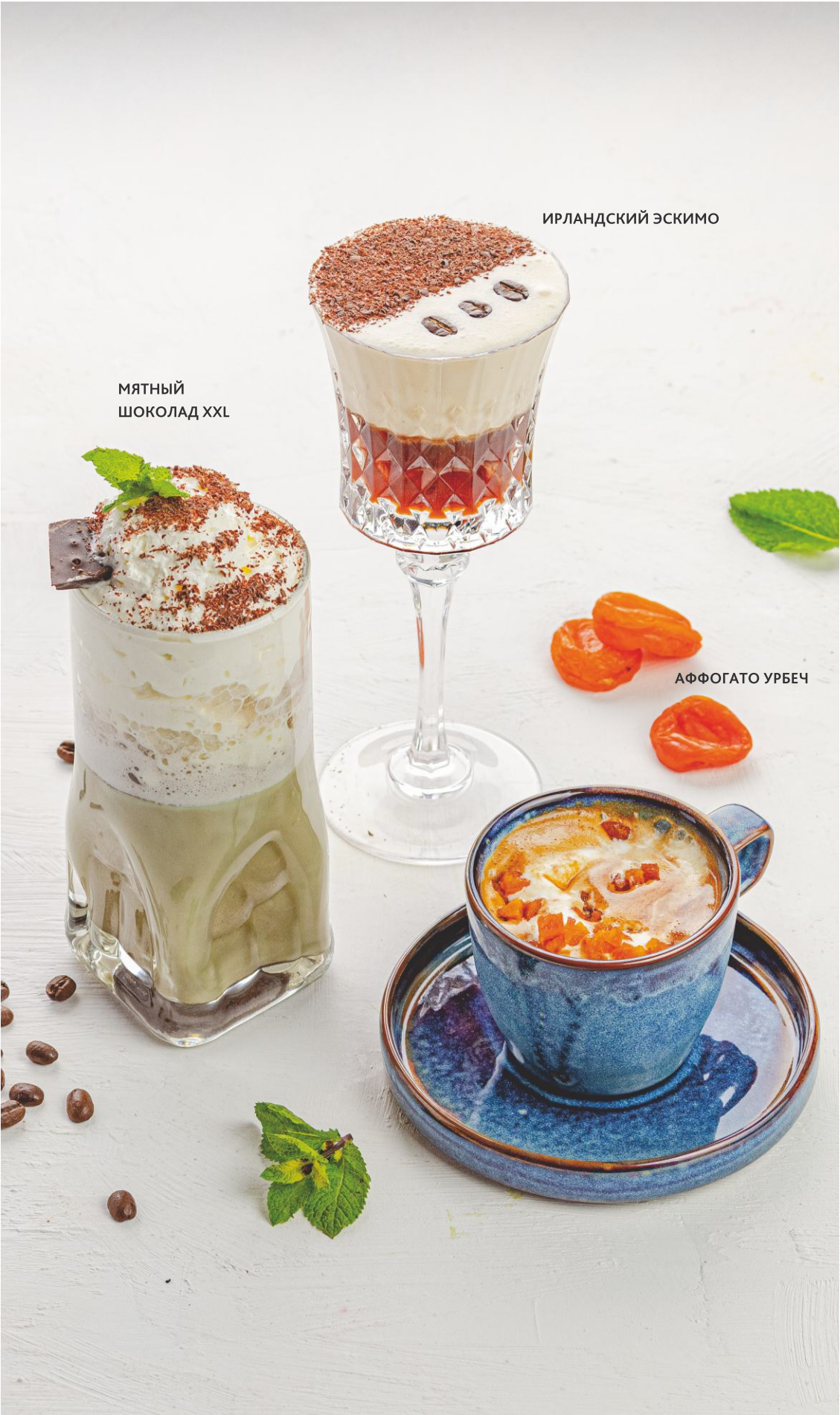
МЯТНЫЙ ШОКОЛАД XXL